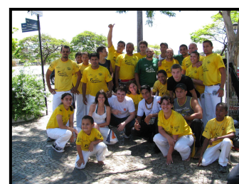
Alunos reunidos após as atividades da manhã