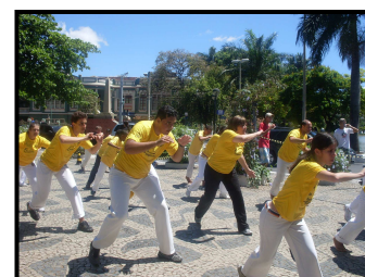
Oficina do CM Boca de Peixe

No final nada como uma roda de encerramento para os participantes trocarem ainda mais experiências, colocarem em prática o que aprenderam durante as oficinas e o que puderam absorver dos participantes com mais conhecimento e tempo de capoeira. Sem dúvida um evento que contribuiu para uma maior consolidação da prática em Sete Lagoas.