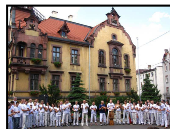
Summer Camp na Polônia - 2009