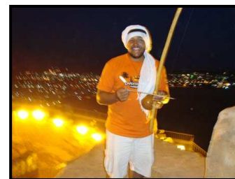
CM Porquinho na Síria - 2009