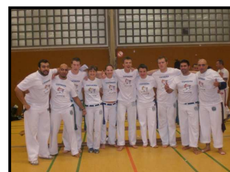
CM Porquinho e CM Boca de Peixe com alunos graduados da Alemanha - 2008