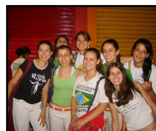
Mulheres da CPPA