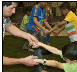
Aula de capoeira para crianças na Síria