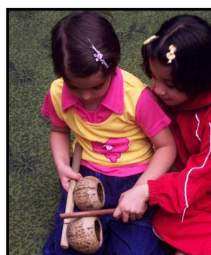
Aula de percussão para crianças na Síria